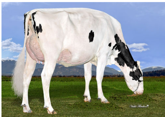
DICKLANDS KING DOC 3503 DAM